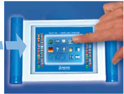
Bedienung und Visualisierung per Touch-Panel